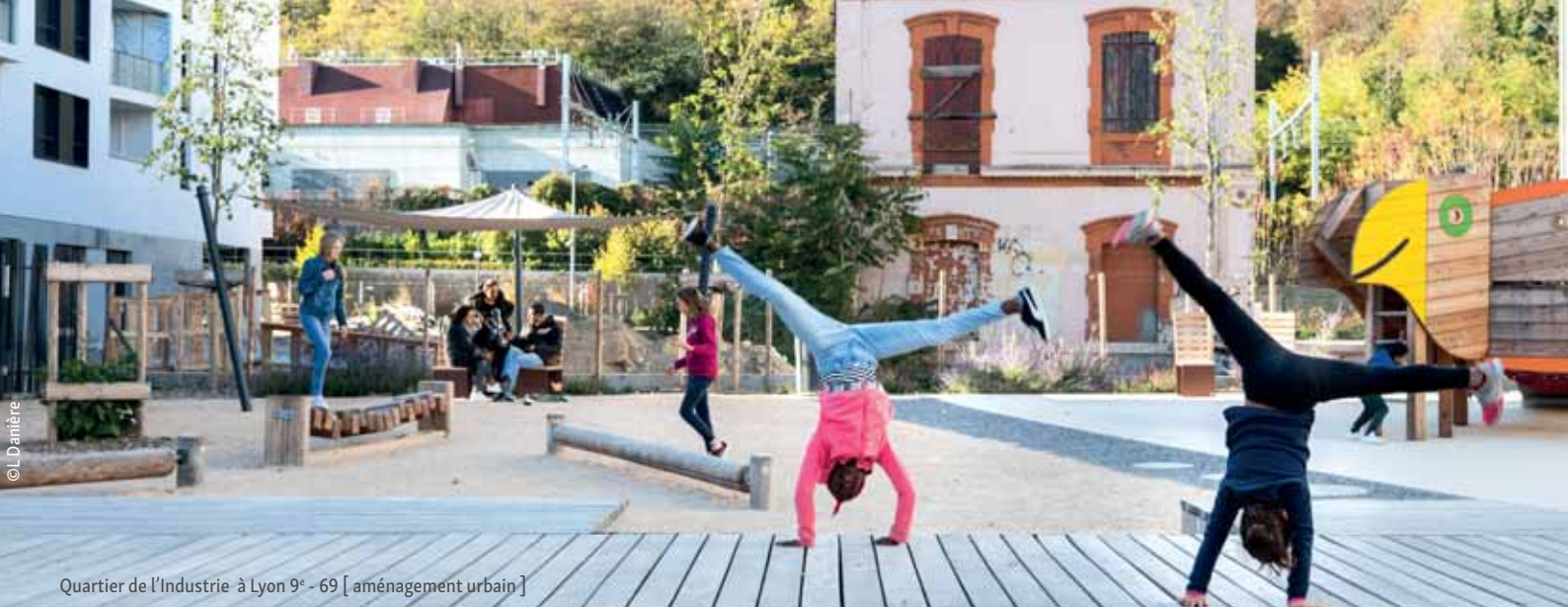
Quartier de l'Industrie à Lyon 9 e - 69 [aménagement urbain]