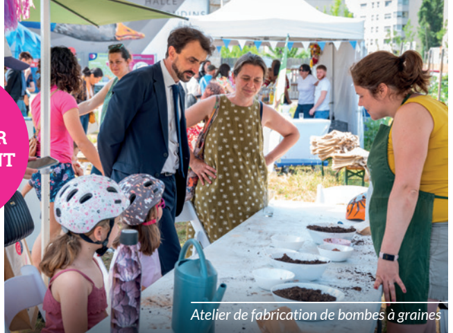
Atelier de fabrication de bombes à graines

Fabrication de bombes à graines, construction de « La ville en terre », recyclage de textiles en petites œuvres d'art... différents stands vous ont amusés autour de valeurs partagées.