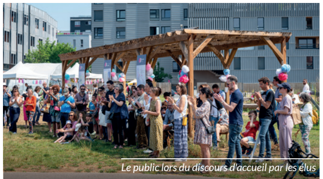
Le public lors du discours d'accueil par les élus

Fabrication de bombes à graines, construction de « La ville en terre », recyclage de textiles en petites œuvres d'art... différents stands vous ont amusés autour de valeurs partagées.