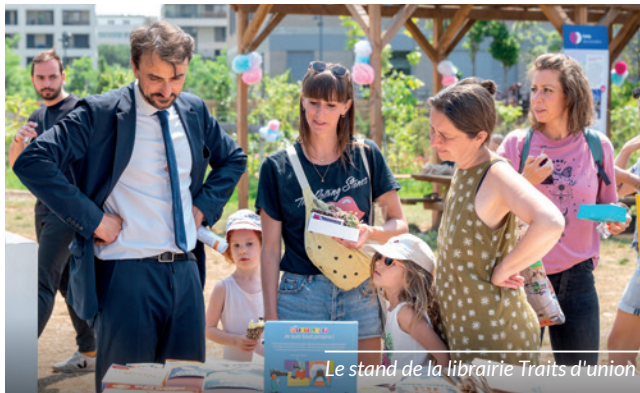
Le stand de la librairie Traits d'union