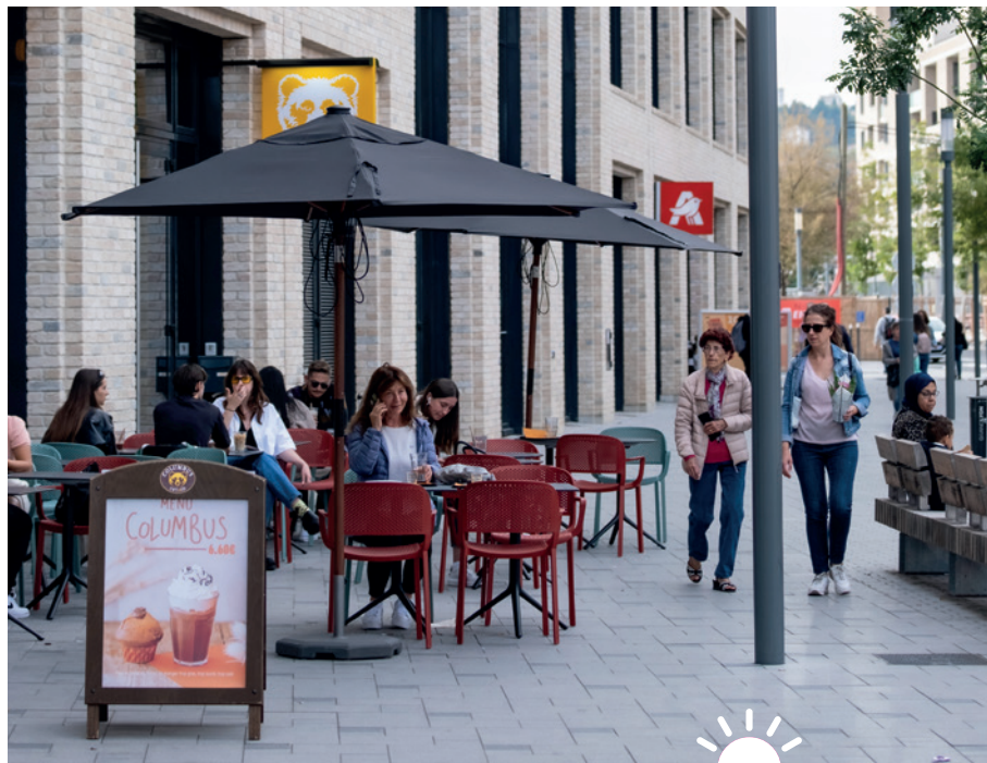
Les commerces de la rue des Girondins