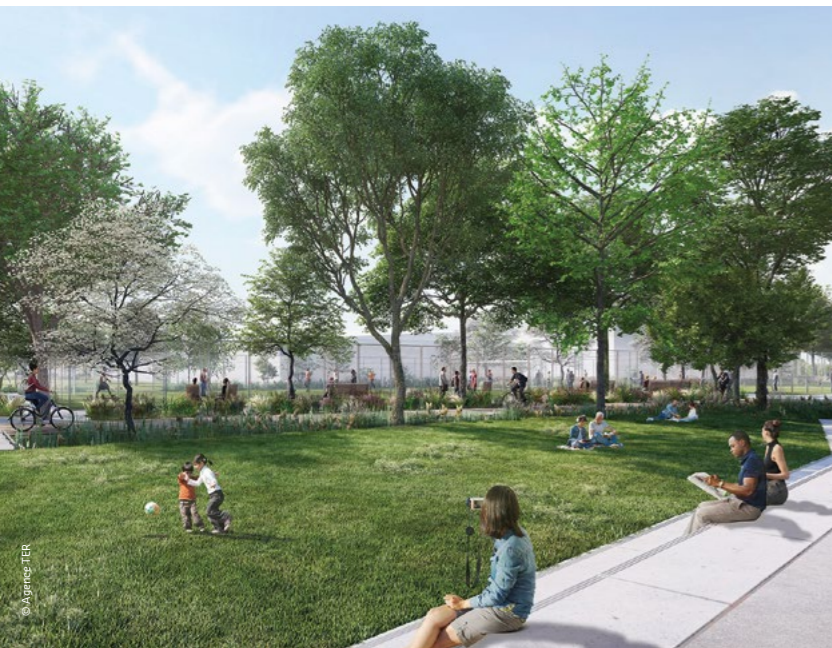
Futur parvis de l'Atelier Léonard de Vinci

Une pépinière a justement été installée en plein cœur du quartier. Sur plus de 2 000 m 2 , 364 arbres et arbustes de 9 essences différentes grandissent tranquillement et s'adaptent au lieu. Dans 3 ans, en 2027, ces arbres seront replantés dans le quartier. Les associations et les écoles sont les bienvenues pour visiter et participer à des ateliers. Une belle occasion d'en savoir plus sur la biodiversité et le rôle de la nature en ville!