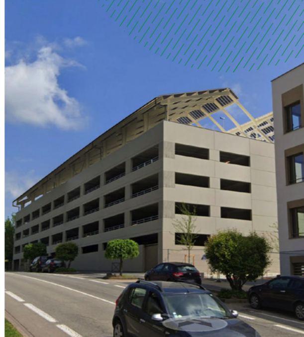
Le projet de toiture photovoltaïque sur le parking silo, Atelier d'ito architectes

Premier projet de BEC, la centrale photovoltaïque sur le parking silo marque le début de son engagement concret. Le permis de construire ayant été accepté en juillet 2024, la construction des 1 500 m 2 de toiture solaire devrait intervenir en 2025. Et BEC n'entend pas s'arrêter là pour promouvoir les énergies renouvelables dans le Beaujolais!