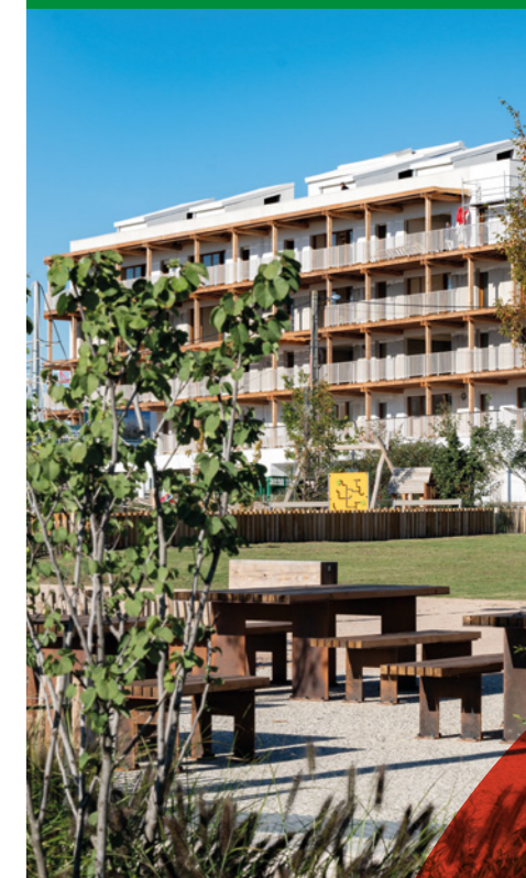
Whood - Fontanel immobilier